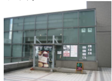
「みとう庵」さいたま新都心合同庁舎

このうち、一般の方が入店可能な3店舗を下記に記載していますので、是非一度ご賞味いただければと思います。