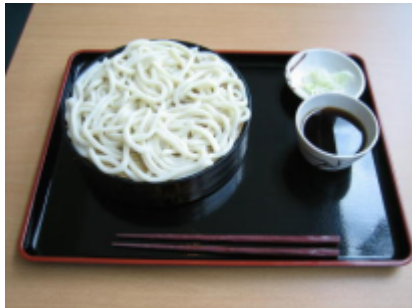
もり(せいろ)うどん 280円