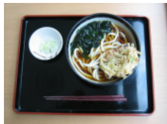
かき揚げ天 どん 380円

野川麵業(株)(とうきょう米粉ネットワーク会員)では、同社直営店の農林水産省内「藪伊豆」で提供している「うどん」の原材料を全て国産に置き換えるため、昨年秋頃から試作を重ね、米粉20%ブレンドのうどんを開発し提供を始めました。