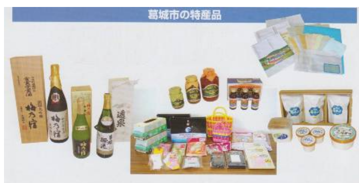
図4 葛城市の特産品

本市では、ソーラーパネル、プラスチック、メリヤスをはじめ、多くの製品が製造され、県内でも有数の工業地帯になっており、中でもパルプ・紙部門では県下1位の出荷額を誇っている。また、造園業も昔から地場産業として根付いている。