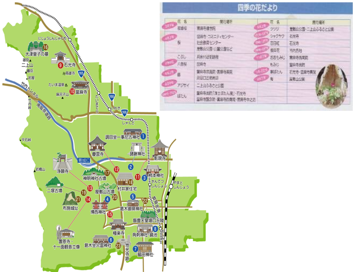
図3 葛城市の観光・レクリエーション

身近な憩いの場としては、二上山ふるさと公園、葛城山麓公園、サッカー場併設の新町公園など自然に親しみながら散策や運動が楽しめる都市公園が整備されている。