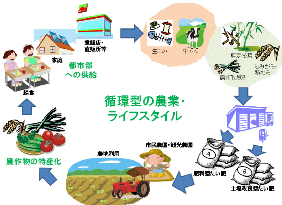
図6 たい肥化と利活用のイメージ