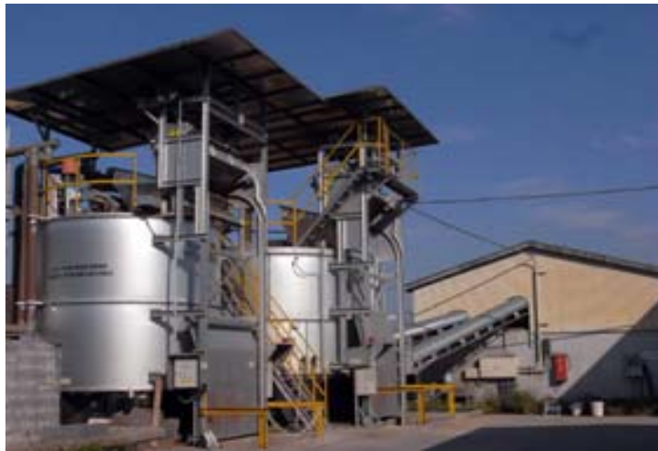
図9 家畜排せつ物たい肥化コンポスト