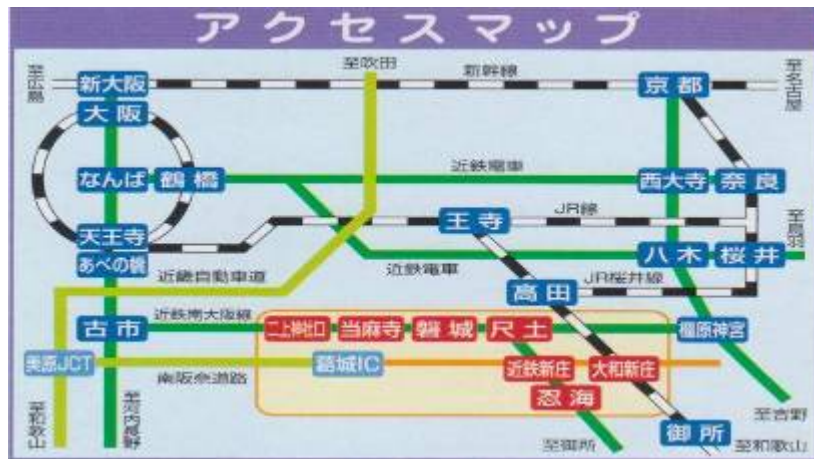
図2 葛城市アクセスマップ

道路は、広域道路網の背骨となる南阪奈道路があり、大阪方面や関西国際空港方面などと直結している。また、南阪奈道路と接続する国道165号大和高田バイパスをはじめ、国道24号、同166号、同168号、県道御所香芝線などがあり、都市の骨格となる道路網が形成されている。近年、これらを補完する中道・諸楯線や疋田本線などの整備により、市の南北方向の機能強化を図っている。