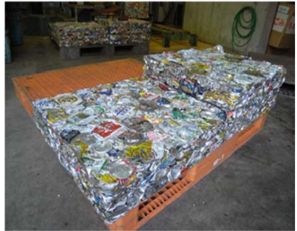
図8 リサイクルセンター当麻クリーンセンター内