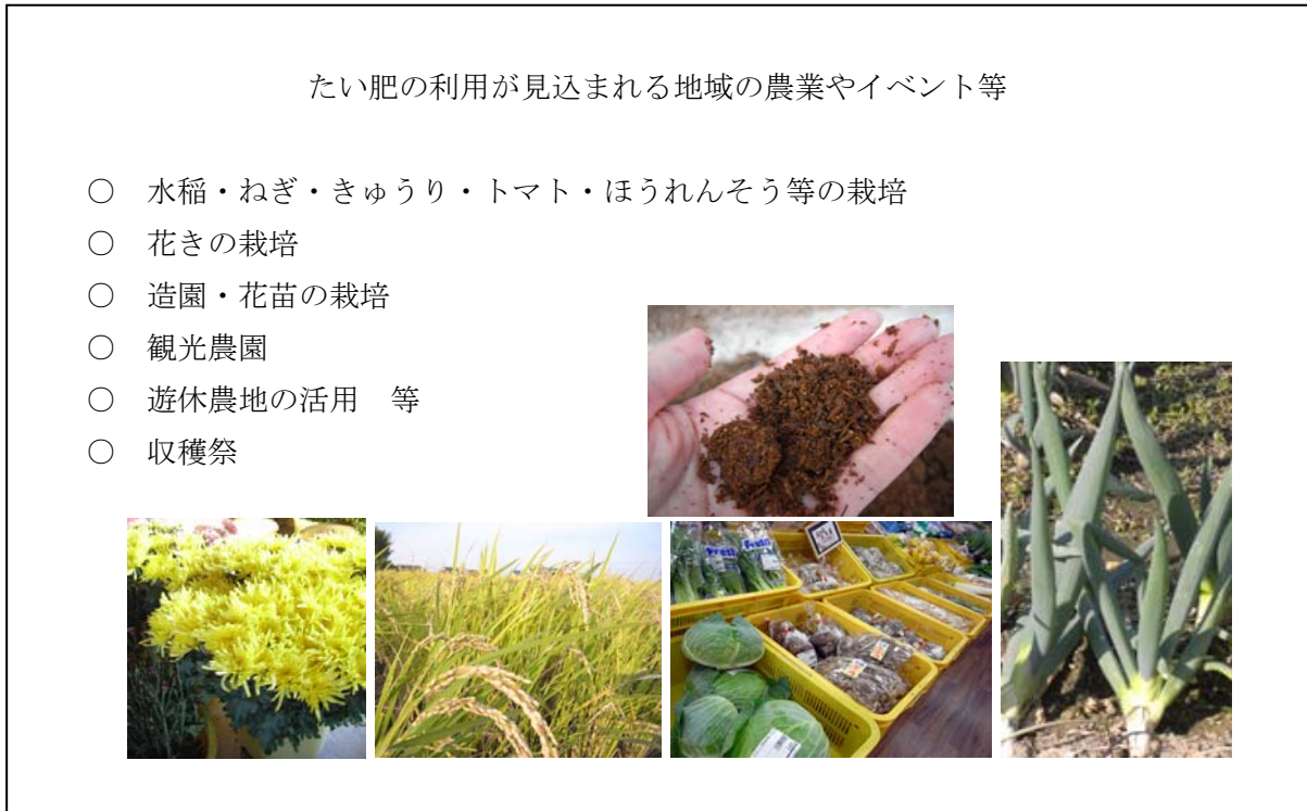
図5 たい肥の利用が見込まれる地域の農業やイベント等

上記の取組により、たい肥利用による循環型農業を推進し、環境にやさしい、おいしい農産物としての特産化を図る。