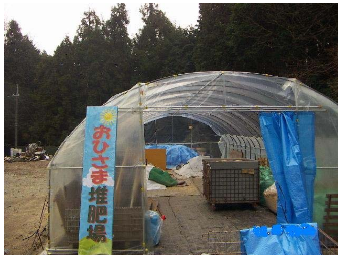
図10 生ごみたい肥化実証実験たい肥場