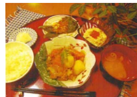
近畿農政局長賞 「舞鶴発祥 肉じゃが三変化」 (グレイスヴィルまいづる)