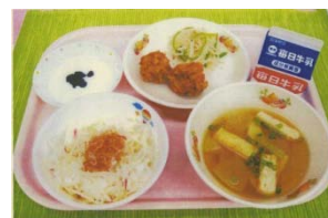
近畿審査員特別賞 「いきいき さわやか わかやま夏メニュー」 (和歌山市立貴志小学校)