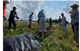
畑での実習の様子