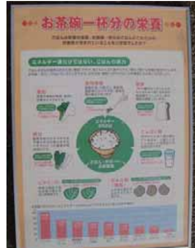
ごはんの栄養素について、ほかの食べ物と比較して説明しています