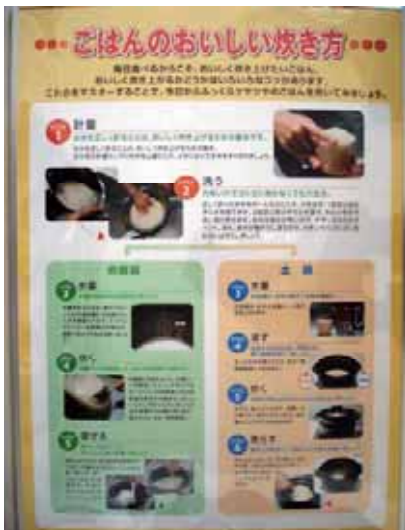
炊飯器と土鍋でのお米のおいしい炊き方がわかります