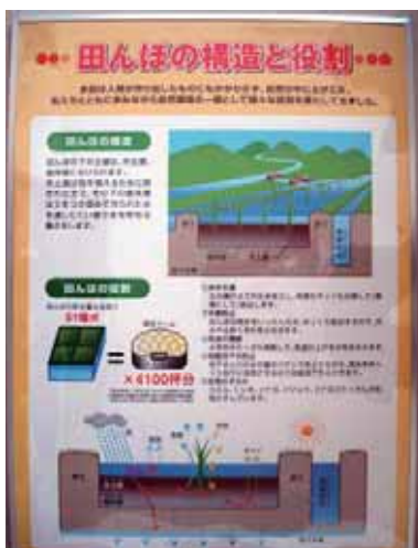
田んぼの構造と役割が一目でわかります