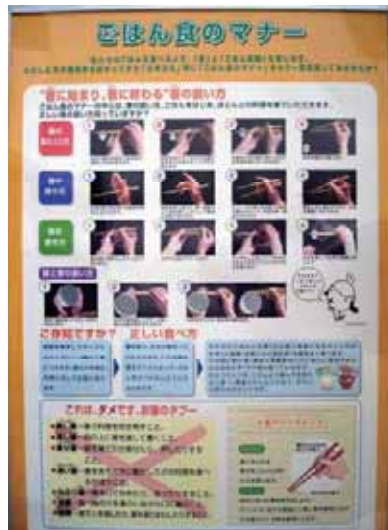
箸の持ち方やごはんの正しい食べ方がわかります