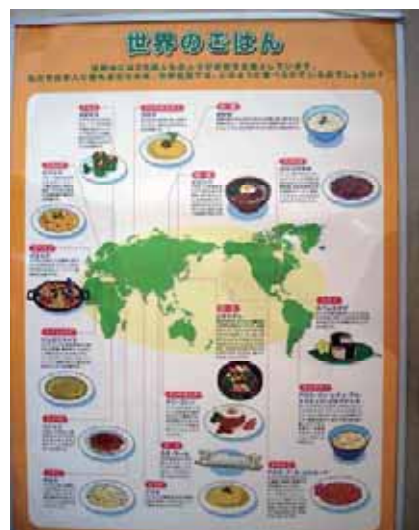
私たちに身近なお米が世界でどのように食されているかがわかります