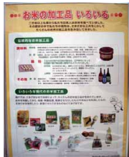
伝統的なお米の加工品と現代のお米の加工品がわかります