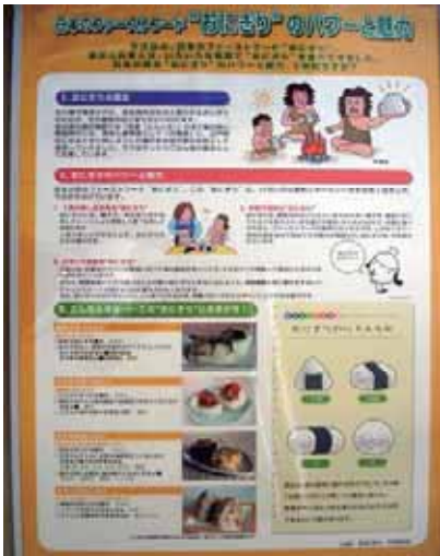
おにぎりの歴史から豆知識までを解説しています