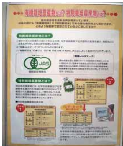
有機栽培農産物・特別栽培農産物の表示基準をくわしく説明しています