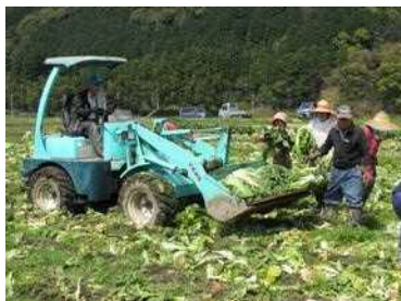
【法人の高菜収穫作業】