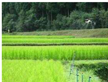
【無人ヘリでの共同防除】