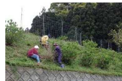
【あじさいロードの草刈】