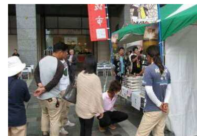
【鹿児島市での交流イベント】