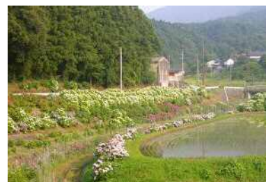
【小野谷あじさいロード】