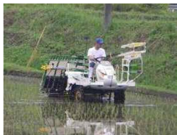
【組合への作業委託】