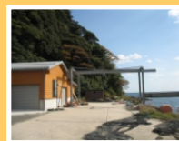
(いわがき加工施設)

体験型定置網や農産物の加工体験・料理教室などによる都市農山漁村交流の推進。 U・Iターン者のための新規就業者技術習得管理施設の整備。