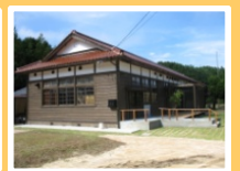
(廃校を活用した加工体験施設)