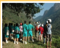
(廃校を活用した交流拠点) (高齢者が指導員として活躍) (子どもの体験交流活動)