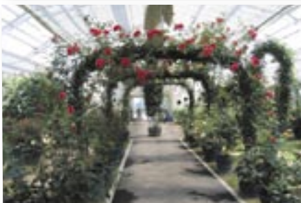
増設されたローズガーデン