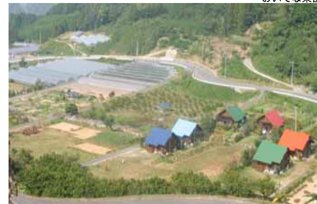
七山の中心部と観音の滝の真ん中に位置するこの施設は、いっばいの青空と澄み切った空気、そして緑の山々と、心なごむ景色に囲まれて、田舎気分を楽しめます。