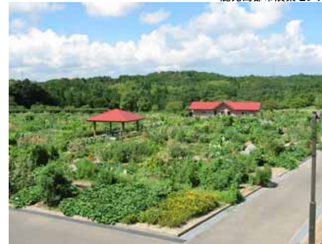
都市農業センターは、農作業体験を行う市民農園ゾーンのほか、各種試験栽培を行う農業研修ゾーン等からなる複合施設です。