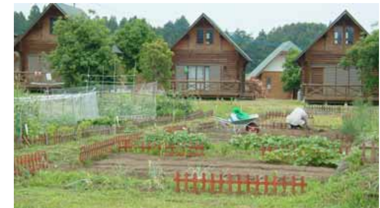
自然豊かな農山村で土に親しみ、心身ともに安らぎ潤いのあるのんびりとした時間が体験できます。宿泊できるログハウス、その他休憩棟、機械器具庫もあり、マイペースの農作業が楽しめます。