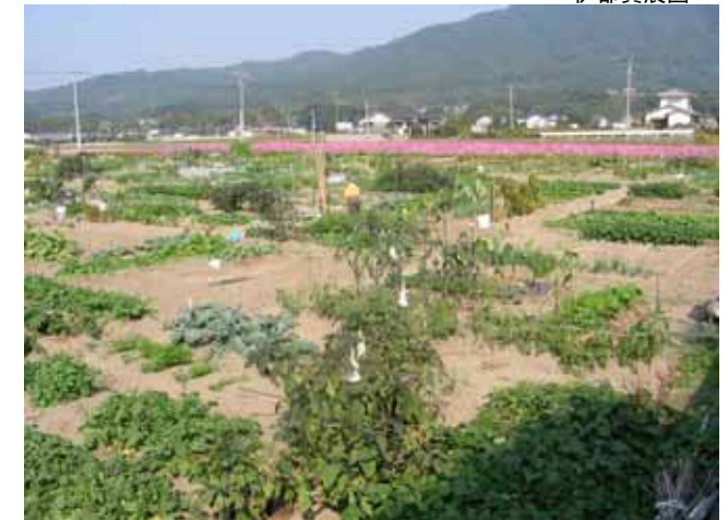
ファームパーク伊都園に隣接しており、自然とのふれあいの中で育てる楽しみや収穫の喜びを体験できます。