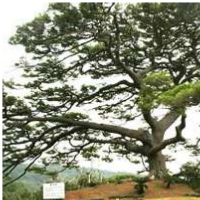
市木「リュウキュウマツ」

奄美市のイニシャルであるAをモチーフとし、奄美の豊かな自然と共生する市民の姿を表現しました。 また、赤い丸は奄美の恵みの太陽を表しています。