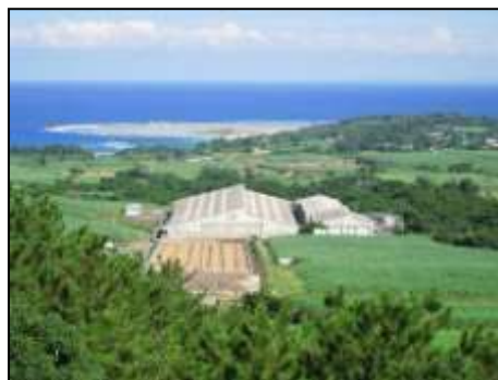
有機農業支援センター(写真)