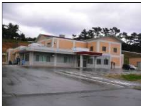
有良汚泥再生処理センター(写真)