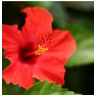
市花「ハイビスカス」