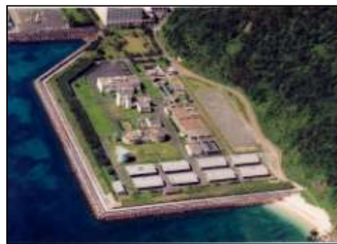
奄美市終末処理場 汚泥乾燥肥料化設備(写真)