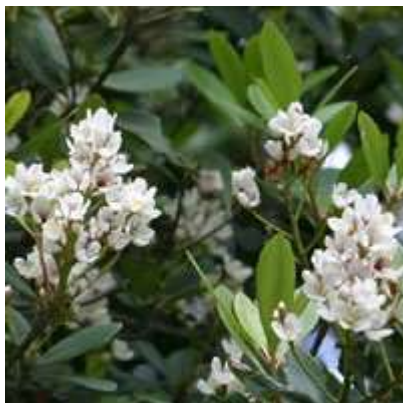
市花「シャリンバイ」