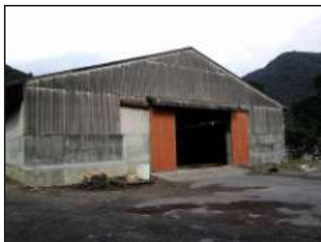
名瀬たい肥センター(写真)