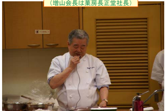
増山会長あいさつ (増山会長は菓房長正堂社長)