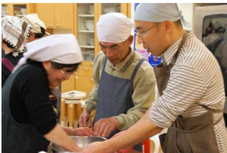
男性の参加者もがんばっておられました。