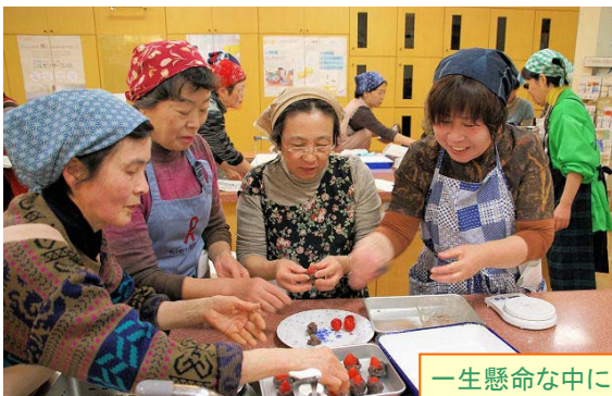
一生懸命な中でも、みなさんすてきな笑顔です。