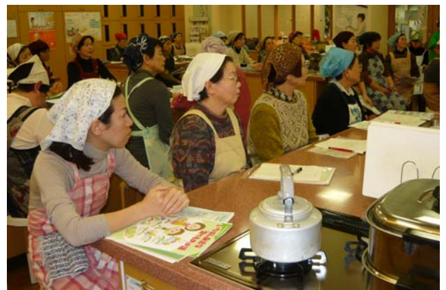
みなさん非常に熱心に聞いておられました。

食料自給率に関するミニ講話を併せて行ったのですが、米粉をからめた15分のコンパクトな説明は、わかりやすかったと、好評でした！