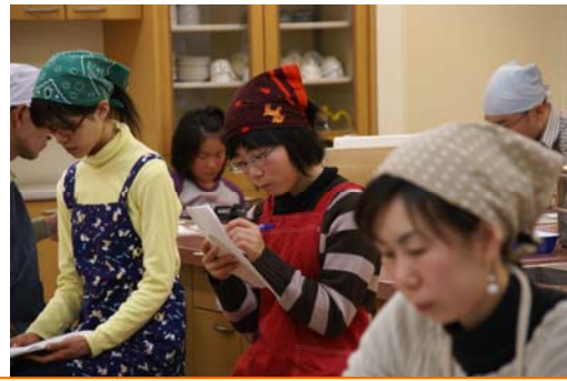
詳しい自給率の話に、真剣なお顔でメモをとる方も・・・

自給率が高い米で作った米粉で、パンや麺を作るようにすれば、その分食料自給率も上がっていく。