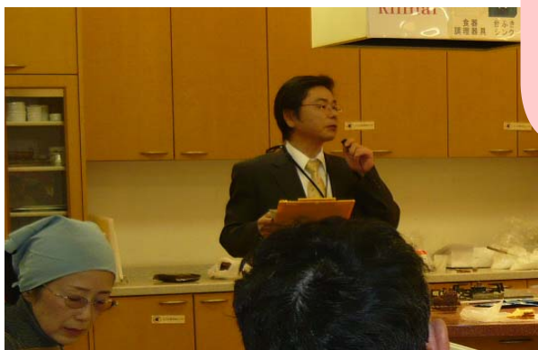
長崎農政事務所による食料自給率のミニ講話

食料自給率に関するミニ講話を併せて行ったのですが、米粉をからめた15分のコンパクトな説明は、わかりやすかったと、好評でした！