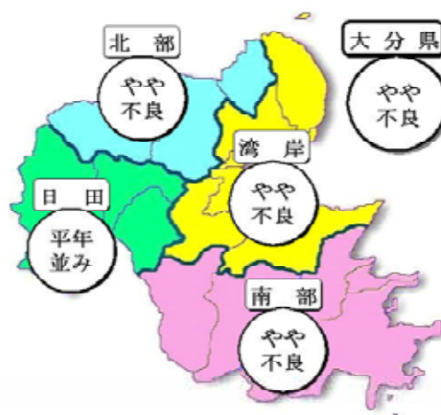
水稻の作柄表示地帯別生育概況

被害は、梅雨明けの遅れにより適期防除ができなかったことから、葉いもち病、紋枯病、コブノメイガ等の発生が見られ、平年に比べ やや多くな っています。