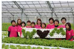
全員女性☆19歳から65歳までの従業員！