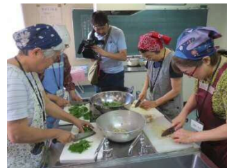
テレビによる取材風景