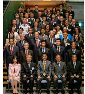
選定団体記念撮影(首相官邸)

また、「ディスカバー農山漁村の宝」特設Webサイト等で活動を紹介するほか、様々なイベントへの出展支援を通じて、全国的な情報発信を行います。