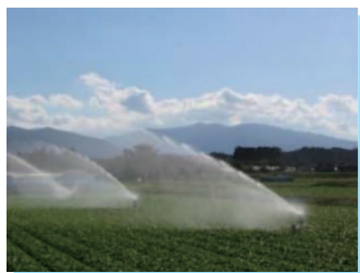
だいこん(かんがい状況)

本地区の営農は水稲及び水田の畑利用等によるだいこん、きゅうり等を組み合わせた農業経営のほか、畑での果樹、茶の専作による農業経営が展開されている。