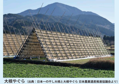
大根やぐら