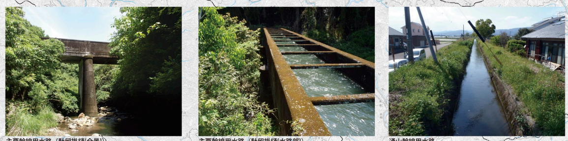
主要幹線用水路 (駄留掛樋[全景]) 主要幹線用水路 (駄留掛樋[水路部]) 通山幹線用水路