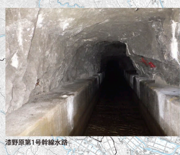
漆野原第1号幹線水路