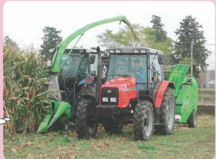
細断型ロールペーラによるトウモロコシの収穫作業