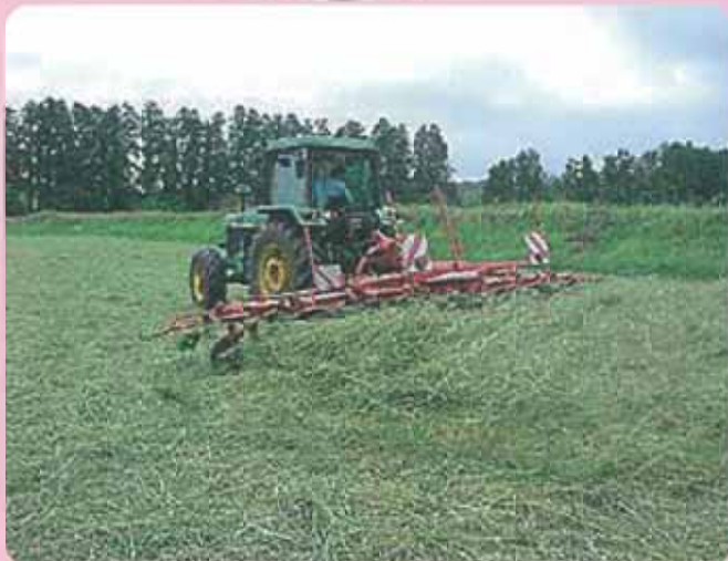
テッターによる飼料調製作業