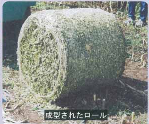
成型されたロール