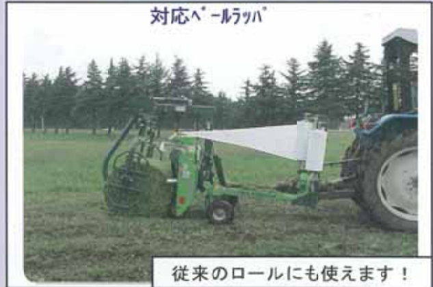
従来のロールにも使えます！