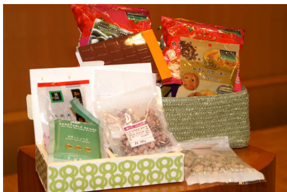
パティスリーポタジエの菓子