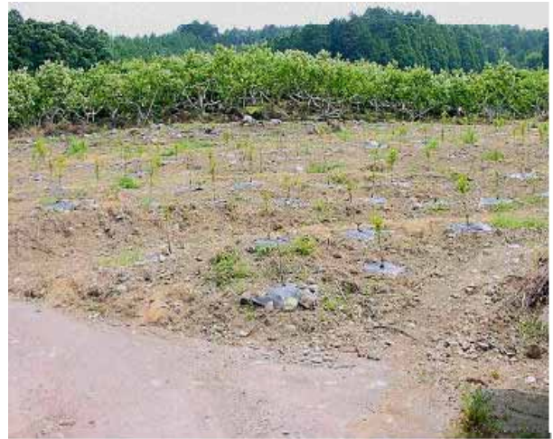
「福岡県うきは市 耕作放棄地からの開墾」 ブルベリー植樹

これは、 耕作放棄地からの開墾 や 田からの 転換 があったものの、 耕作放棄及び宅地等 への転用 などの かい廃 によるものです。