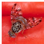
Moscas mediterrâneas da fruta

*Muitas plantas não podem ser importadas de países e regiões onde há ocorrência de fortes danos por pragas. Para mais informações, contate alguma das estações de proteção abaixo.