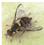
Mosca oriental da fruta