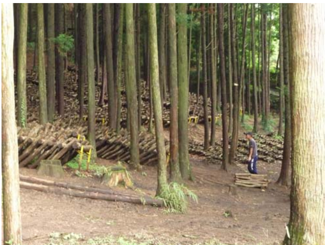
菌が着床され山中に運びこまれたシイタケの原木

作業の詳細をみると、それぞれの能力や適性に応じて分担が決められており、例えば、原木運びをできない園生は山の上で空き缶を叩いてカラスを追い払う仕事をし、高齢化等で体力を使う作業を行えない園生は作業所での組み立て作業や細工の作業を行っている。自閉症の園生の一部は、その障害特性を活かして、ぶどうのつる切りやワインの瓶詰め行程におけるコルクかすのチェックを行っている。また、ワインの封入作業等を得意とする人もいる。このように、それぞれの園生の障害特性を踏まえた作業分担が行われており、重度の障害者も、やり甲斐を感じることができる仕事を持っているのが、「こころみ学園」の大きな特徴となっている。