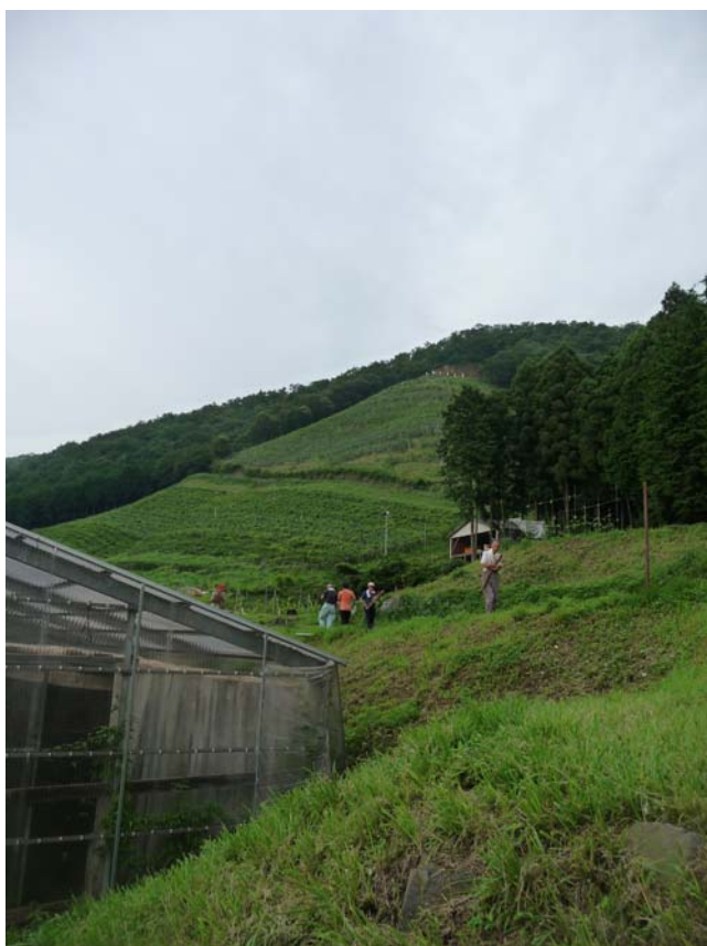
ぶどう畑の前でシイタケの原木運びをする園生の皆さん

通常、社会福祉法人等が農林業に取り組む場合、最初に直面するのが農業生産技術をいかに取得するかという課題である。しかしながら、「こころみ学園」では、初代園長が農