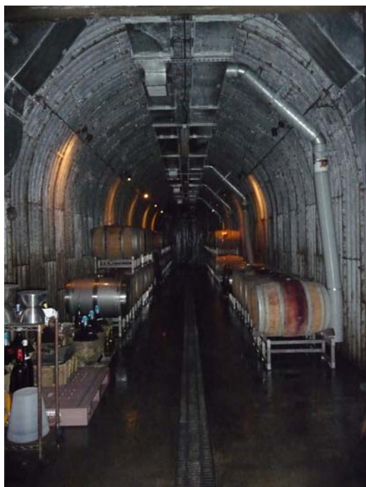
山の斜面を掘って作られたワイン貯蔵庫

有限会社「ココ・ファーム・ワイナリー」の従業員は、1980年の創業時には13人であったが、その後、生産規模が増大するにつれ増加し、現在は31人が勤務している。31人のうちの18人が地元採用となっている。現在、同ワイナリーの取締役を勤めている米国人の醸造技術者が、1989年に来日し、ワインづくりの指導を行ったのが、今日の高い水準のワイン生産に結びついている。この技術者以外にも、現在はワイン製造の専門家が8人勤務しており、ワインの品質の維持・向上に努めている。