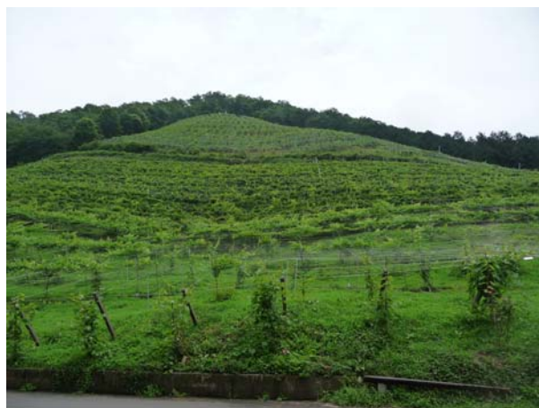
一番最初に開墾されたぶどう園(上部は45度の斜度、下部は38度の斜度がある)

園生が実施している作業は、ぶどう園の管理・収穫作業、原木を使ったシイタケ栽培(年間4～5トンの販売量)、山林除抜、間伐、植林、下草刈りの作業を約20ha(この作業を行う中でしいたけ栽培用の原木を確保している)地域の林家から請け負っている。また、2000年には敷地内に作業所を立ち上げており、金属を扱う製造業の下請け作業、箱折り、ハンガーのリサイクル(ハンガー磨き)、炭焼き機で作った炭等を使った自主製品の制作等も行っている。