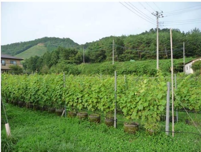
休耕田で栽培されているぶどう（遠くに最初のぶどう園を望む）

幹旋で、近隣の休耕田を借地しているが、ぶどう畑として必要なまとまった面積が借りられないことや、水田を畑地化することの問題点などもあり、なかなか条件の合う農地が見つからないという問題も抱えている。