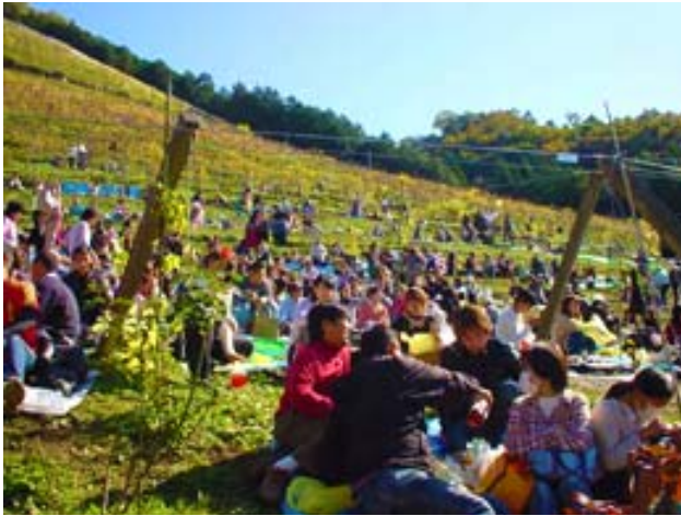
収穫祭の様子

地元野菜を使った料理や地元農産物の加工品を提供することで、地元農産物の販路の確保やそのPRの面でも貢献している。