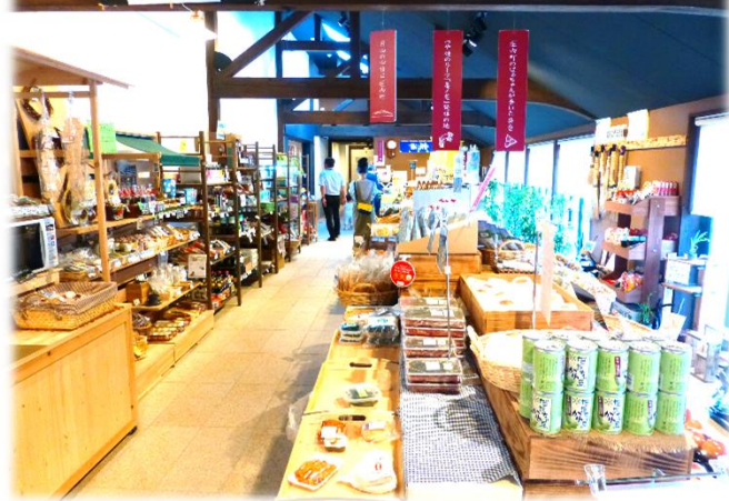
新鮮な地場産農産物や加工品が並ぶ販売ブース

貸工房は最長5年間利用でき、平成27年7月現在3団体が入居しています。また、共同利用加工場の会員は、個人、企業・団体を合わせ150を越えています。この共同利用加工場は、会員登録すれば町内外の誰でも利用できるシステムとなっていますが、「6次産業化を志し、販売目的をもった方」が登録条件となっているため、趣味目的では利用できません。ここに庄内町の6次産業化に対する強い意気込みが感じられます。