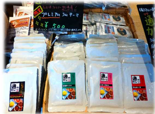
工房生まれの6次化商品