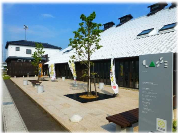
青空に白い瓦屋根が映える庄内町新産業創造館

クラッセには、地域食材を活かした新しいスタイルの料理が楽しめるレストラン、新鮮な地場産野菜をはじめ農産加工品や地域の手工芸品を展示販売する販売ブース等があり、人気の観光スポットとなっていますが、それ以上に脚光を集めているのが、6次産業化工房です。