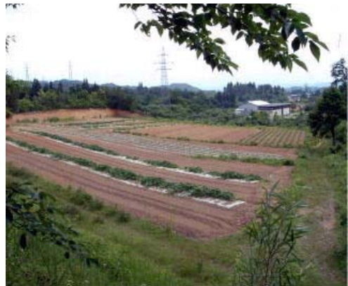
トラスト運動により有志で買い取った農地