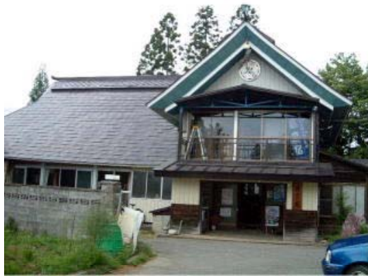
旧家を利用したそば屋「蔵高塾」。季節営業であるが、日常的にむらづくり活動の拠点として多くの地区住民が集う。