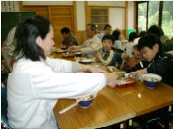
地元食材をふんだんに使った昼食