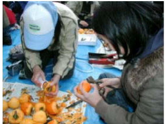
稲作体験のほか、ころ柿づくりなどの季節に応じた多彩なメニューを体験できる。