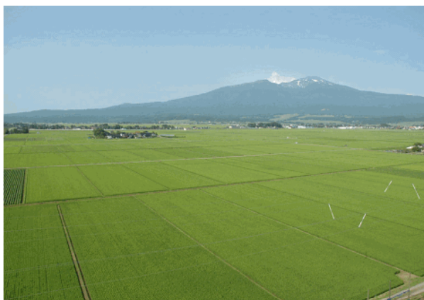
鳥海山と遊佐町の水田地帯