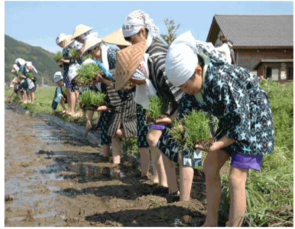
産地交流会で遊佐を訪れた子供たちの田植え体験