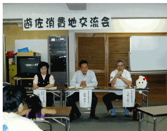
消費地交流会。部会員が主な出荷先である関東方面に定期的に出向き、消費者との意見交換や共同開発米の取組を説明。