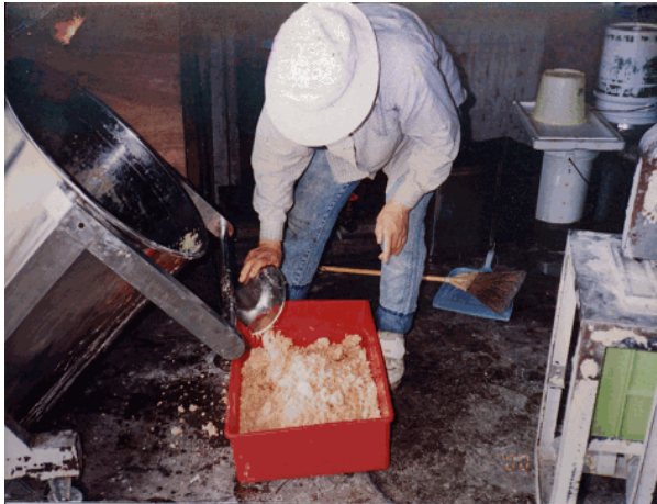
せっけんの加工状況。農家の女性達を中心となり、食用廃油を粉せっけんや固形せっけんに加工し販売。