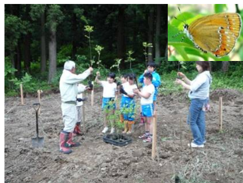
写真6 トネリコの植栽 (写真右下がチョウセンアカシジミ)

具体的な取組みとしては、集落内に自生しているトネリコの木の下草刈りや雪囲いを行うとともに、新たに集落内3ヶ所に150本のトネリコの幼木を植栽し、長期的に生息できる環境の整備を行っている。