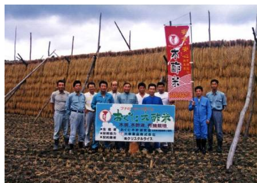
写真3 木酢米の生産

この取り組みは、地元にあるものを活用して、より付加価値の高いお米を生産しようと、昭和60年頃から集落内の一部の農家が始めたもので、当時は町内外から木炭・木酢液を仕入れ、試行錯誤しながら取り組んでいたが、平成4年からは、集落内に建設された薬品会社の副産物である木炭や木酢液を活用し、技術指導も受けながら徐々に生産を拡大してきた。