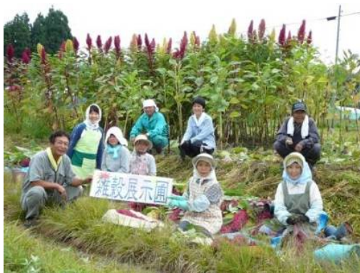
写真4 雑穀展示ほ場

また、この畑の一部を、タカキビ、キビ、アワ、ヒエ、ハトムギ、アマランサスなど各種雑穀の展示ほ場として活用し、みんなで管理を行っており、景観形成にも一役買っている。