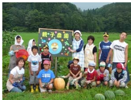
写真 7 親子農園

今後、これらの取組みが定着・拡大していくことが見込まれ、将来的には定住人口の増加につながることを期待されている。