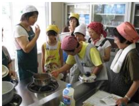
写真5 雑穀料理講習会

こうした取組みなどによって、田沢頭集落を発信源として町全体に雑穀料理が普及し、町の活性化にも貢献している。