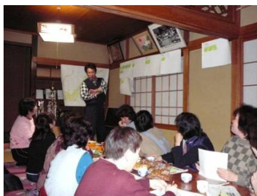
写真2 ワークショップの実施

なってワークショップを開催したり、アンケート調査を実施した結果、150項目にも及ぶ提案が出された。この提案を、すぐに実施できるもの、2～3年後に実施するもの、5年後、10年後の実施を目指すものなどに区分するとともに、農地の活用、環境保全、食などの10のテーマ別に整理し、自治会の新たなむらづくりの活動計画として取りまとめた。