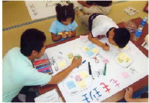
写真 1 ワークショップの開催

平成 17 年 8 月には「地域の宝さがし」と題したワークショップを行い、子どもから高齢者までの意見を反映した集落のマスタープランを作成し、「活かそうふるさとの自然」をスローガンに、地域の自然や伝統を次世代に継承していく取組を進めている。