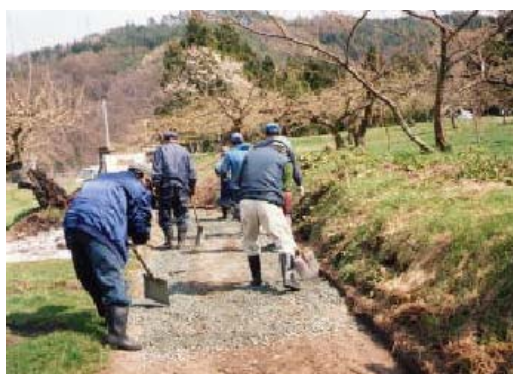
写真3 集落住民による農道整備

二又中山間組合では、農業生産基盤の維持も必要と考え、集落住民自らの手で農業生産に必要な農道や水路の整備を行っている。このうち農道は、整備が必要とされるものを集落で検討し、毎年約100mずつ計画的に整備してきたことによって、当面は農業生産に支障をきたすことがない状況まで整備が進んでいる。今後も必要に応じて計画的に整備を続けることとしている。