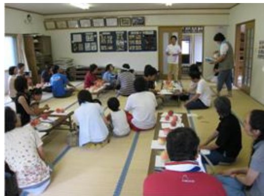
写真 4 消費者交流会

平成 14 年から始まった観光農園事業の P R を目的に、消費者交流会を毎年実施している。当初は、ももの品種を食べ比べたり、郷土料理を提供する内容であったが、近年は野菜などの地場産品や、ももを使った料理教室、楽しみながら農業の知識が身に付くミニクイズ、野菜の詰め放題などが行われ、新しいアイデアによって交流会の内容が充実してきている。また、スタッフ T シャツを作成して集落の一体感を出すなどの工夫も行っている。