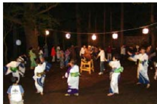
写真 5 ナニャドヤラ踊り

集落の代表たちは、集落に昔の賑わいを取り戻すため、住民の心の礎である伝統文化ナニャドヤラ踊りの復活を決意