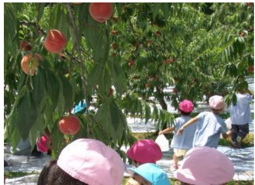
写真 2 観光農園での収穫体験

しかし、なんとしても交流を成功させて地域を活性化したいという強い意志と、果物を食べたときの来園者の笑顔が支えとなり、接客マナーや体験メニューの改善に取り組んだところ、来園者は徐々に増加し、近年では 130 人前後の参加があり、今では南部町でも指折りのイベントとなっている。