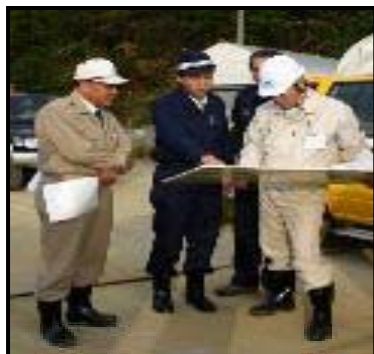
①農地・農業用施設等の現地被災状況等の把握に係る支援

各都道府県（以下「各県」という。）の農村防災・災害対応協議会（仮称）（または準備会）（以下「協議会」という。）の定めにより、以下のような活動を行います。