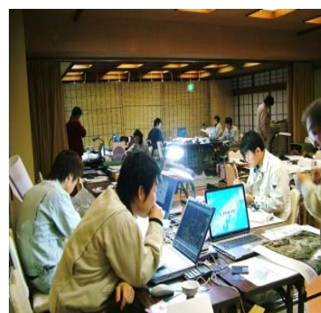
③災害復旧業務（災害査定に向けた準備業務）に係る技術支援