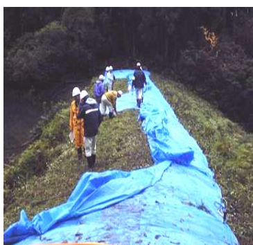
②応急対策に係る技術支援