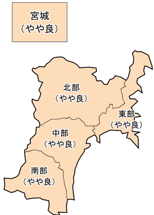
図 作柄表示地帯別作柄の良否