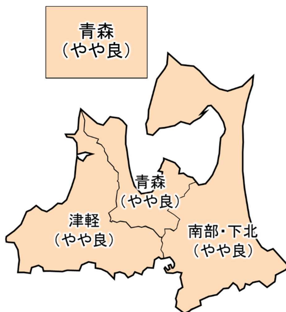
図 作柄表示地帯別作柄の良否