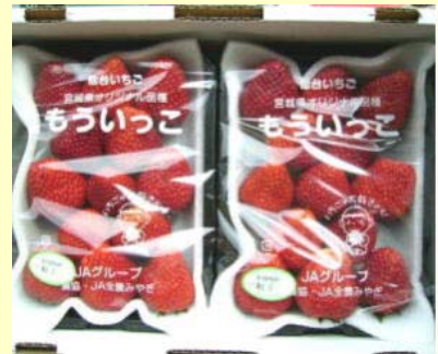
出荷した「もういっこ」

いちごの生産量で東北一のJAみやぎ亶理では、特産品のいちごのブランド化を目指し、宮城県が仙台いちごの新品種と位置付け平成17年に開発した「もういっこ」を香港へ輸出する取組を開始した。同品種は、果実は比較的硬いため日持ちが良く傷みにくいことから輸出に向く品種といわれており、県、同JA及びJA全農宮城が三者共同で、この新品種を日本産果物の人気が高い香港へ輸出することとした。