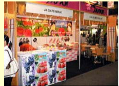
出店ブースの様子

同J Aでは、更なる輸出販路の拡大を図るため、果実と野菜専門の国際見本市にもも等を出展した。