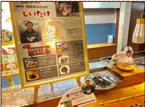
【生産者紹介パネル】

花巻市農村青年クラブの協力を得て、共通食材の農産物が不足した場合、クラブ員間で補うとともに、配送を花巻温泉郷内の青果物店に依頼することにより、旅館・農家双方の荷受・配送の負担が減り、供給の安定化につながっています。旅館利用者が必ず食べる朝ごはんに地元食材を提供することにより、確実に地元農産物の消費拡大につながっており、農家から旅館への納品額が大幅に増加しました。