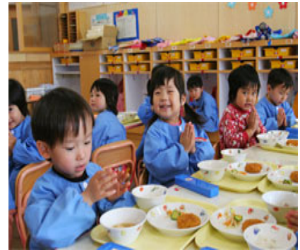
学校給食への供給体制の事例

・ 学校給食での地場農産物利用を通して、子供たちの農業と食べ物に関する理解を促進。農作業体験や生産者との交流も積極的に導入。