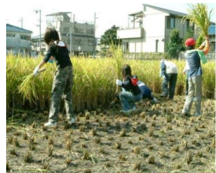
(学習田での稲刈り) 自ら農作業を行うことで、食べ物への理解が深まります。