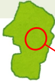
山形県大江町三郷 山形県寒河江市柴橋