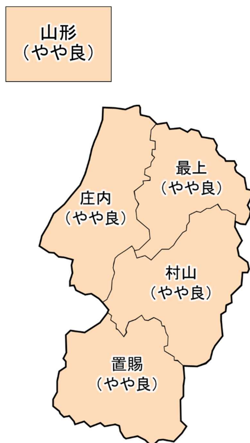
図 作柄表示地帯別作柄の良否