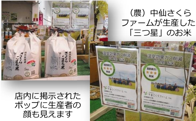
店内に掲示されたポップに生産者の顔も見えます