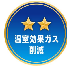
温室効果ガス削減への貢献

また、米については、生物多様性保全の取組の得点に応じて評価し、温室効果ガスの削減貢献と合わせて等級表示できます。