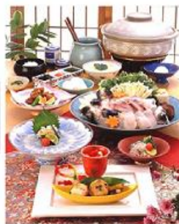
とらふぐフルコース