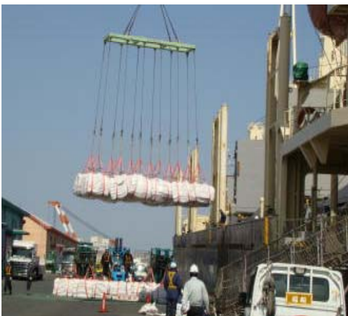
◆ 荷揚げ スリングバック