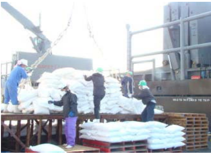
◆ 荷揚げ 30kg樹脂袋