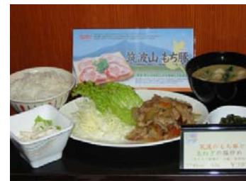
地場産を活用したイベントメニュー(茨城産のもち豚を利用したメニュー)の提供(全体メニューの約15%程度)

※地場産の定義を比較的広く捉え、東京だけでなく、神奈川、千葉、茨城などで生産されているものも「地場産」としている。