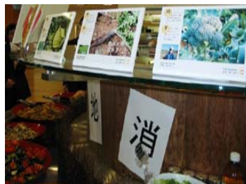
サラダバーでの地場野菜の提供(神奈川県三浦産等)

給食業者(エームサービス)は、通常の納入経路と別に、神奈川県三浦市の納入業者から本食堂に地場野菜を納入するなどして、地場農水産物を活用したメニューを開発