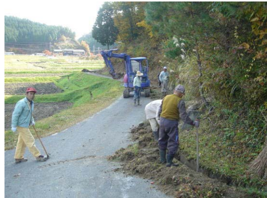
<共同農道整備> 泥上げによる農道整備