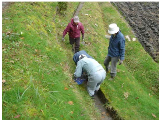
<共同水路整備> 芽地埋めによる水路補修