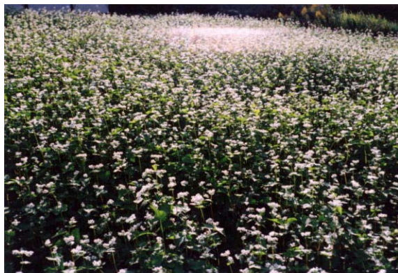
景観作物（そばの花）