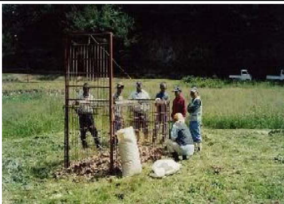
有害鳥獣による被害を防ぐため、檻を設置・維持管理を行う

そこで、地方振興事業及び市単独事業で設置した鳥獣防止柵及び捕獲檻の維持管理を直接支払制度の共同取組活動の一環として行い、また、有害鳥獣のすみかとなる恐れのある耕作放棄地を発生させないよう年数回集落の共同取組活動としてこれらの農地の草刈りを重点的に行うことにより農地を獣害から守る体制の強化を図った。