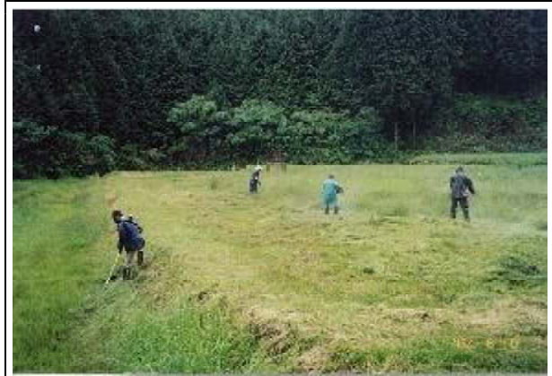
集落協定参加者による農地の草刈及び周辺林地の下草刈り