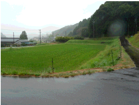
【法面管理、道路幅員確保、周辺林地草刈り】