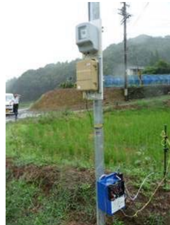
【電気柵の維持管理】