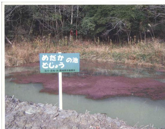
農地・水・環境保全向上対策と連携し整備したメダカ池