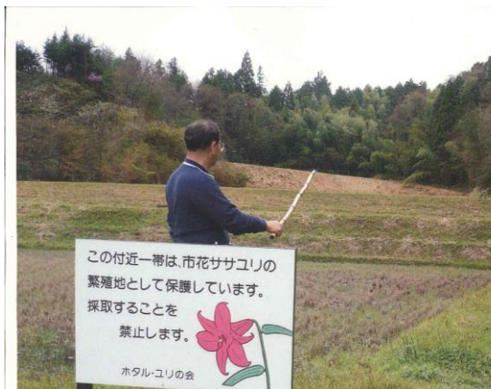
里山保全によりササユリが復活

また、農地と一体となった里山の下草刈りをするることにより、今では珍しくなった市の花ササユリの自生地保護にもつながっている。