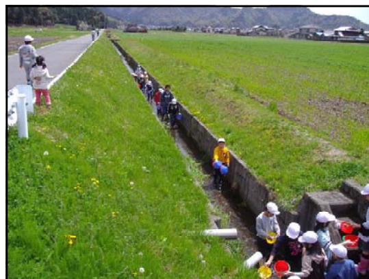
カワニナ保護風景