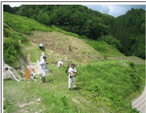
草刈りの共同作業

また、棚田で生産した農作物の付加価値向上を図るため、「棚田天然米」、その米にあわ、ひえを混ぜた「三穀米」、「棚田にんじん」、「寒干しダイコン」など特産品の開発とブランド化を推進し、高山市の観光名所である朝市等で販売している。