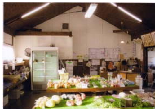
山村にある農産物直売所（愛知県新城市）

グリーン・ツーリズムで田舎に出かけたその行き帰りに、農産物直売所に立ち寄ってみるのも農山漁村に親しむ良い機会となります。