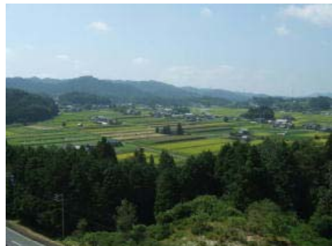
のどかな農村の景観（岐阜県恵那市）