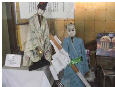
知多半島に伝わる郷土文化（愛知県美浜町）

田舎には、古くから伝承されている建造物、美術工芸品、音楽、祭りなど歴史的に価値の高い様々な文化があります。このような文化財などは、多くが一般に公開されており、農山漁村の人々が築いてきた文化を学ぶことができます。