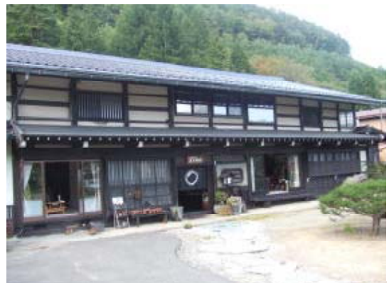
古風な造りの農林漁業体験民宿 (岐阜県高山市)

農山漁村余暇法により農林漁業体験民宿には登録制度が設けられており、施設管理面、食事等への地域の農林水産物の積極的活用などの基準を満たした民宿の登録が行われ、そのような民宿が東海3県では、現在37カ所あります。