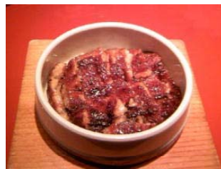
ひつまぶし (愛知県)