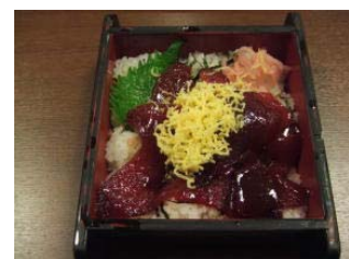
手こね寿司 (三重県)