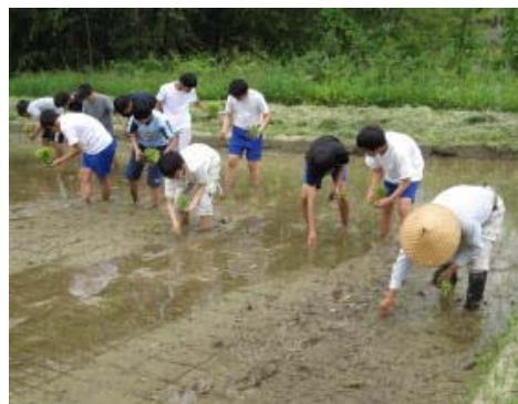
田植えに取り組む中学生（岐阜県高山市）

例えば、水田での田植えや畑での野菜植付けなどの農作業体験、山林での間伐作業体験、川でのカヌー遊びなど自然の中での体験、その土地の農産物・水産物などを使った加工体験など多彩なプログラムが用意されています。