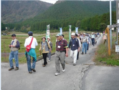
都市との交流イベントの様子

○集落での交流イベントを開催(エコツーリズム推進のための棚田・湧水等の自然観察会、ノルディックウォーキング等)することにより、多くの都市住民と交流することができた。