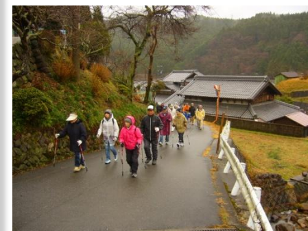
ノルディックウォーキングの様子