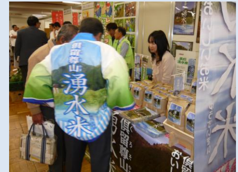
移住交流イベント・マルシェブースの様子

○石川県羽咋市神子原地区は限界集落から脱した奇跡の集落と言われ、高齢・過疎化に歯止めがかからなかった地区でしたが、今では全国の農業関係者からの視察が絶えないほどの画期的な米づくりが行われている。その土地で収穫した稲藁・米ぬかだけを肥料にした完全無農薬農法で米づくりが行われており、国連が認める世界農業遺産にも登録された注目の農法です。また、東京においてバチカン市国のローマ法王に神子原米を献上できたことで、様々なメディアに取り上げられ、神子原米は名実とも一大ブランドとしての地位を確立した。