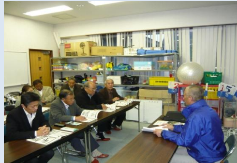
集落資源を活用した地域への視察研修の様子

○農産物(プライベートブランド米)の高付加価値化の推進及び集落のすばらしい農村環境(清水平湧水等)を活用した都市農村交流も年々参加人数が増加している。