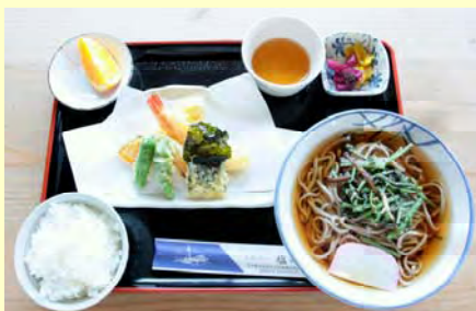
天ぷら山菜そば定食