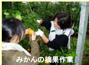
みかんの摘果作業

体験に興味のある方は、事前に下記URLから、「体験・施設」→「五ヶ所湾体験ワールド」をご覧になっていただき、南伊勢町観光協会にお問い合わせください。