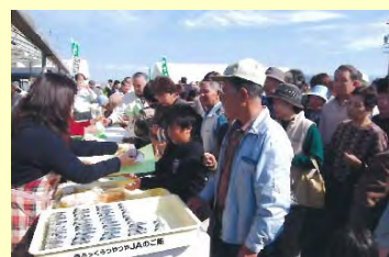
減農薬米のおにぎり、米粉パンに人・人・人の人だかり