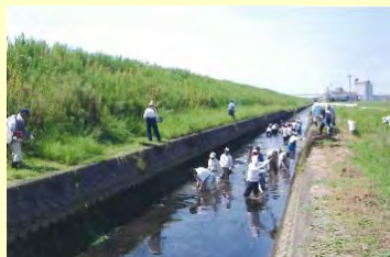
町民総出の川役活動

このような活動を通して、住民同士の触れ合いもでき、少しずつですが、住民の環境意識が高まってきているように感じています。