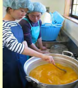
みかんジュースづくり