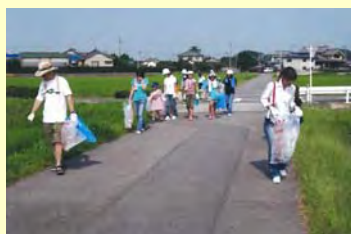
みんなで一緒に取り組みました！清掃活動展開中