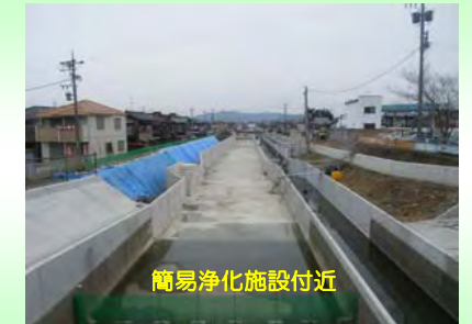
簡易浄化施設付近